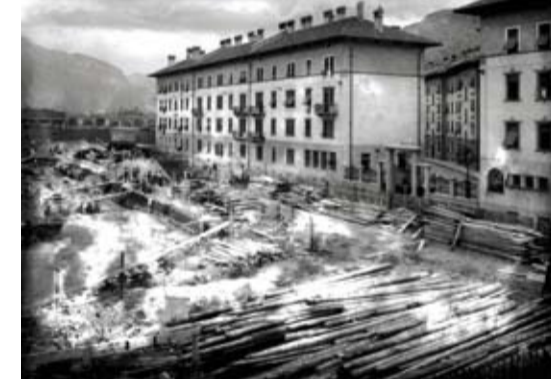
Remis - Archivio Fotografico Storico Soprintendenza per i Beni Storico-Artistici Provincia autonoma di Trento